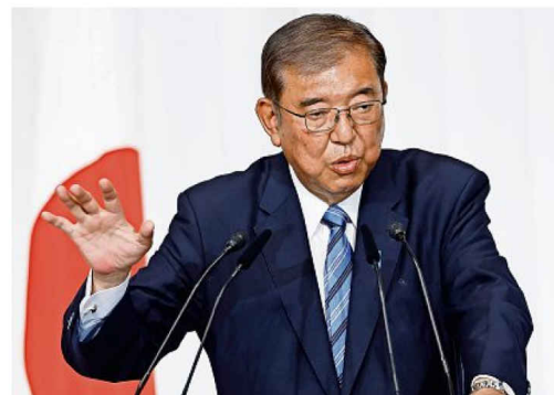
Schwere Niederlage: Japans Regierungschef Shigeru Ishiba hat die Mehrheit im Unterhaus verloren.

Das Parlament muss nun innerhalb von 30 Tagen zu einer Sondersitzung zusammenkommen, um dann beide Kammern über den künftigen Ministerpräsidenten abstimmen zu lassen.