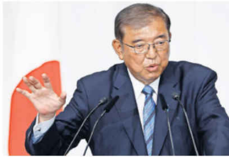
Schwere Niederlage: Japans Regierungschef Shigeru Ishiba hat die Mehrheit im Unterhaus verloren.