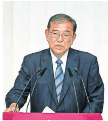
Der japanische Ministerpräsident Shigeru Ishiba.

Der Erfolg von Nodas Oppositionspartei zeige dem Wahlvolk, dass es jetzt eine Alternative zur LDP gebe,